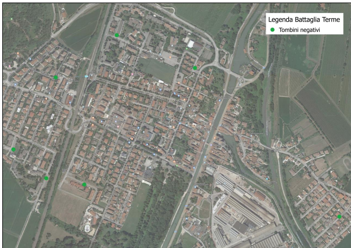
Figura 1: posizione georeferenziate delle vie dove sono stati effettuati i campionamenti nelle caditoie (le coordinate GPS rilevate in campo sono soggette ad un margine di errore di alcuni metri).

Di seguito sono riportate le posizioni georeferenziate delle vie in cui è stato effettuato il campionamento delle caditoie nell'area comunale in oggetto.