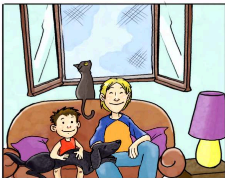
IN CASA USA LE ZANZARIERE ANZICHÉ ZAMPIRONI E FORNELLETTI.